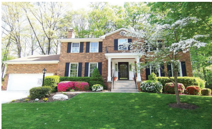
Herend Place, Fairfax, Virginia: egy villa a sok közül

Majdnem harminc éve fedeztem fel Herendet, habár nem itthon, Veszprém vármegyében vagy Budapesten, hanem Amerikában. Itthon ugyanis majdnem annyiszor látogattam el Herendre, ahány éves vagyok, viszont nem striguláztam az osztálykirándulásokat vagy a családi látogatásokat, illetve az ottani tolmácsolásaimat sem, hogy a két tárlatnyitásomat meg se említsem. Jó érzés otthon lenni Herenden még ennyi év után is, de meglepődni igazán csak két helyen lepődtem meg: Albertfalván, azaz Budapesten és Fairfaxben, azaz Virginia egyik járásában. Mindkét helyen található ugyanis Herend utca: az előbbi helyen szépen bokrosítva, tehát Fonyód utca, Kisbér utca, Adony utca és Körmend utca társaságában: Még az se árt neki, hogy kettéválasztja a Sáfrány utca, de egy kis kanyarral szépen folytatódik.