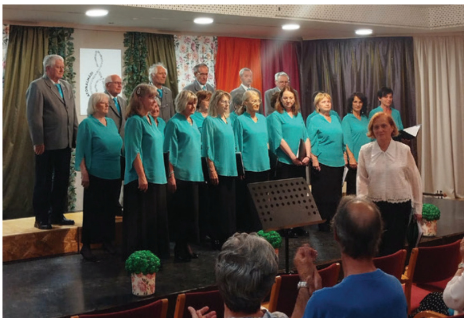
Balatonalmádi Város Vegyeskar

Mindkét rendezvény hűen bizonyította, hogy Balatonalmádi zenei élete és közösségi összetartása rendkívül erős. A vastapsok és a mosolygós arcok egyértelművé tették: a helyi énekkarok nemcsak megőrzik, de folyamatosan meg is újítják városunk zenei hagyományait.