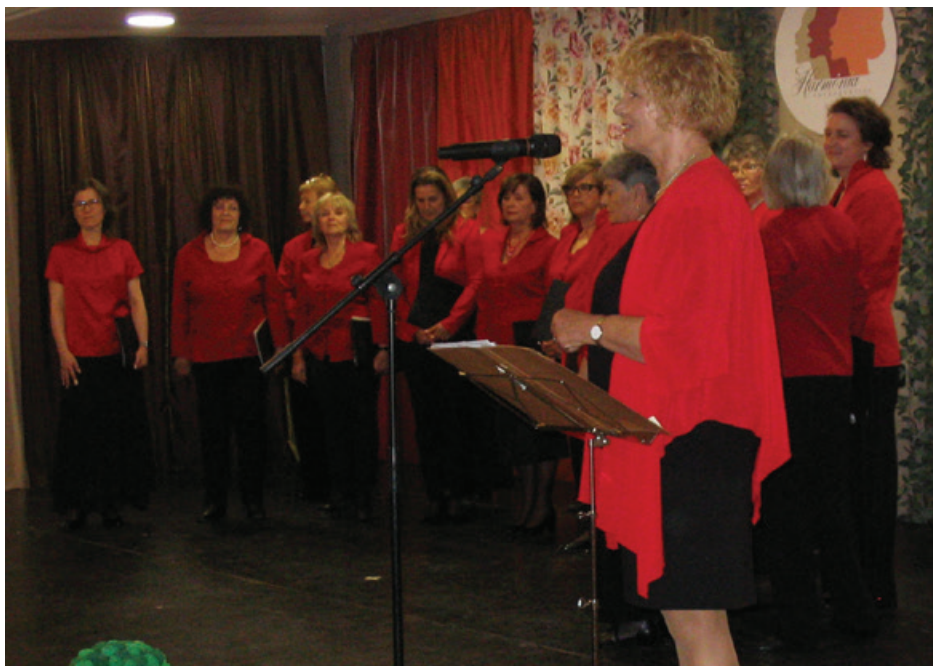
Harmónia Énekegyüttes

Kiemelkedő kulturális élményekkel gazdagodhattak a balatonalmádi zenerajongók május folyamán, hiszen a város kedvelt zenei formációi ismét dallamokkal töltötték meg a Pannónia Művelődési Központ és Könyvtár nagytermét. A tavasz és a pünkösdi időszak hangulatát idéző két önálló hangversenyen a helyi kórusok vendégművészekkel összefogva nyújtottak felejthetetlen esteket a közönségnek.